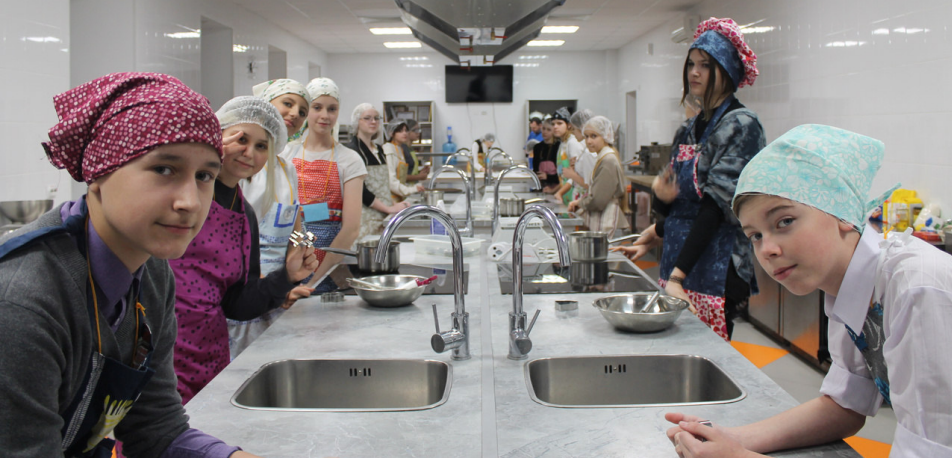
Мастерская Деда Мороза