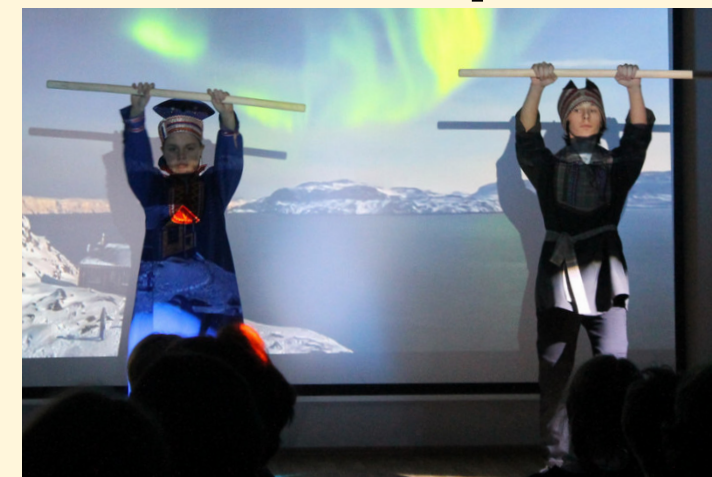
Сценка из жизни саамов