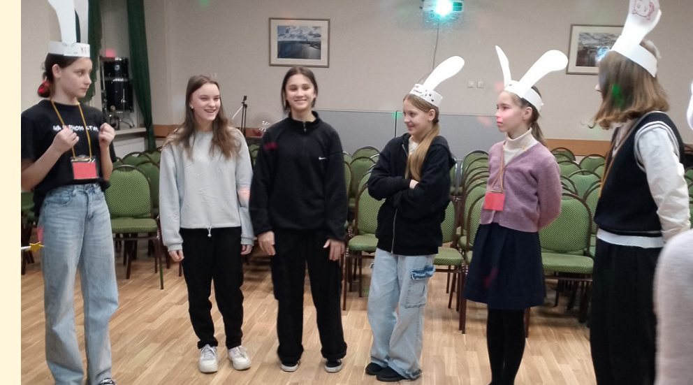
Мастерская юных снегурочек